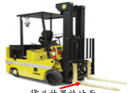
貨叉放置於地面 圖 2